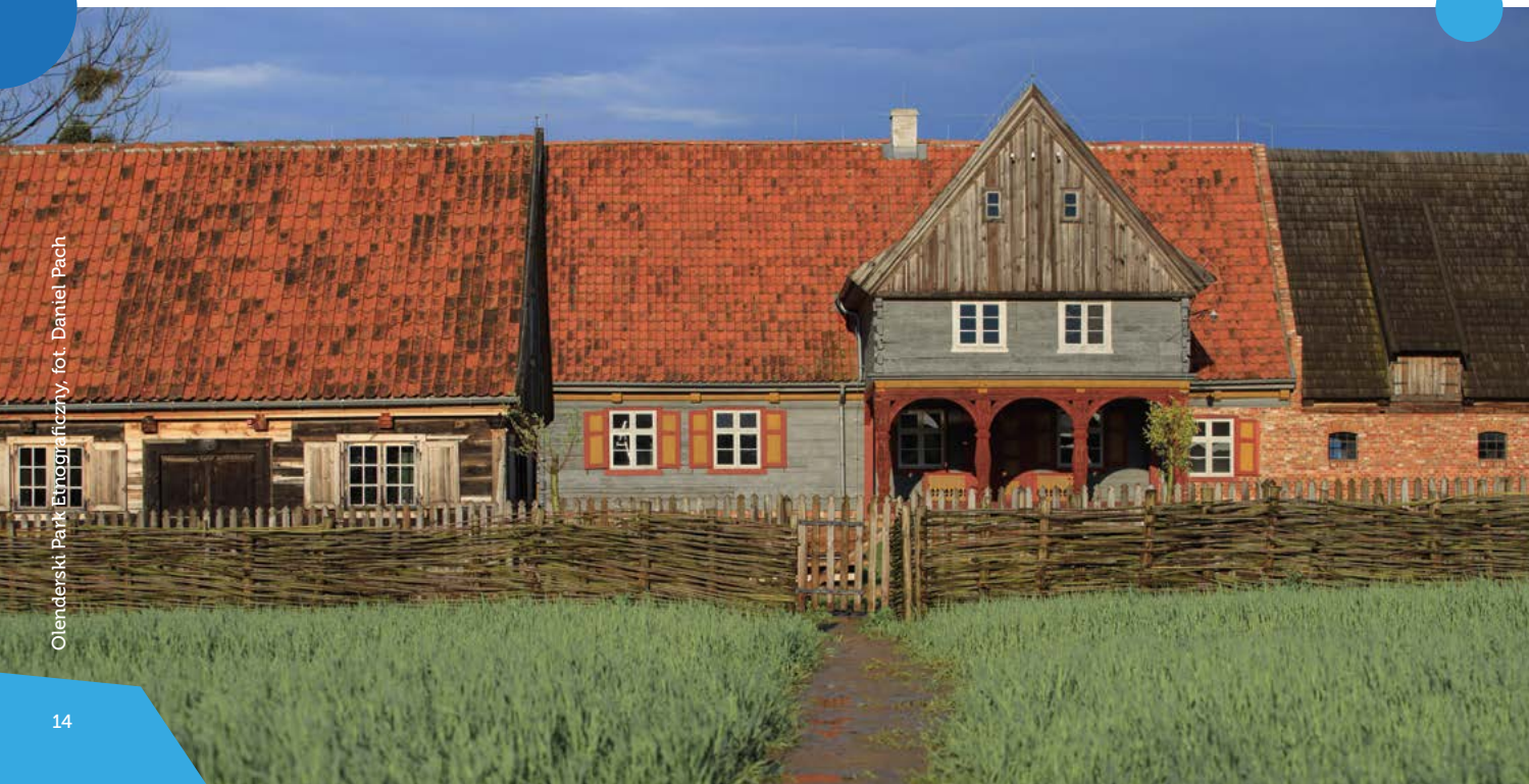
Olenderski Park Etnograficzny

z przełomu XIX i XX w. Przeniesione tu z Doliny Dolnej Wisły zagrody to najcenniejsze, zachowane do dziś, przykłady architektury charakterystycznej dla olenderskich osadników. Wraz z otaczającymi je polami uprawnymi, łąkami i sadami tworzą obraz dawnej wsi. Jego dopełnieniem jest menonicki cmentarz, znajdujący się na terenie parku.