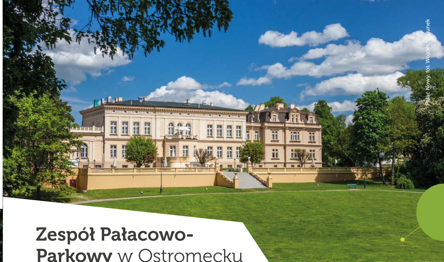
Pałac Nowy, fot. Wojciech Zdunek