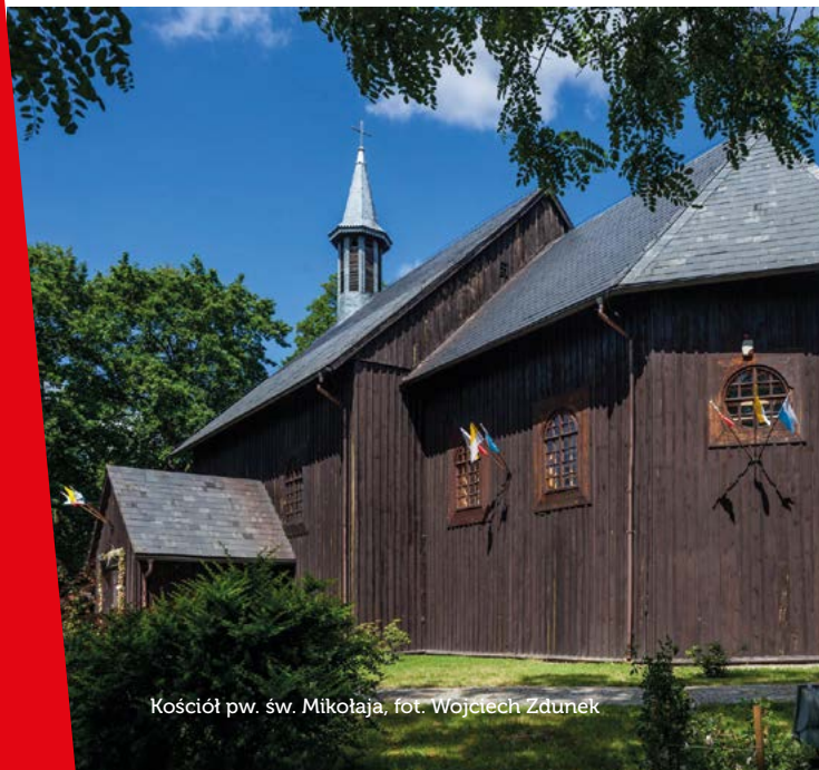
Kościół pw. św. Mikołaja

Gąsawa zapisała się w historii jako miejsce, odbywającego się w 1227 r., zjazdu książąt piastowskich, podczas którego zginął Leszek Biały. Książę, niespodziewanie zaatakowany w łaźni, próbował ratować się ucieczką w stronę wsi Marcinkowo. Tam poniósł śmierć. Akt ten upamiętnia pomnik w Marcinkowie Górnym, ukazujący jadącego konno, nagiego księcia, ugodzonego strzałą przez ludzi Świętopetka.