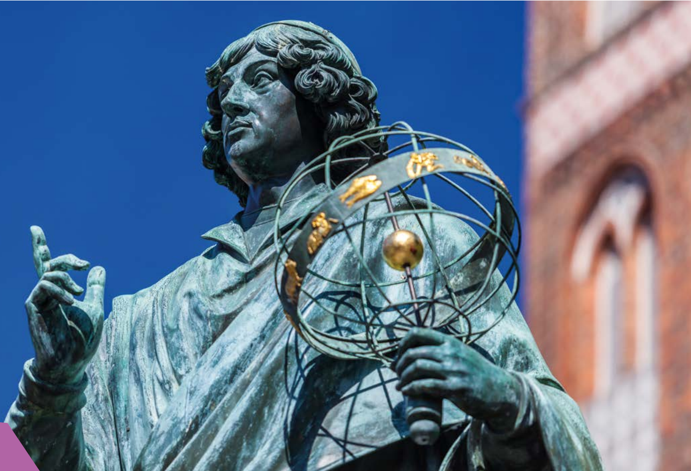
Pomnik Mikołaja Kopernika

– Planetarium Toruń (Certyfikat POT). Siedząc wygodnie w fotelu podbijesz bezkres wszechświata, poznasz gwiazdozbiory, odkryjesz tajemnice odległych planet i galaktyk.