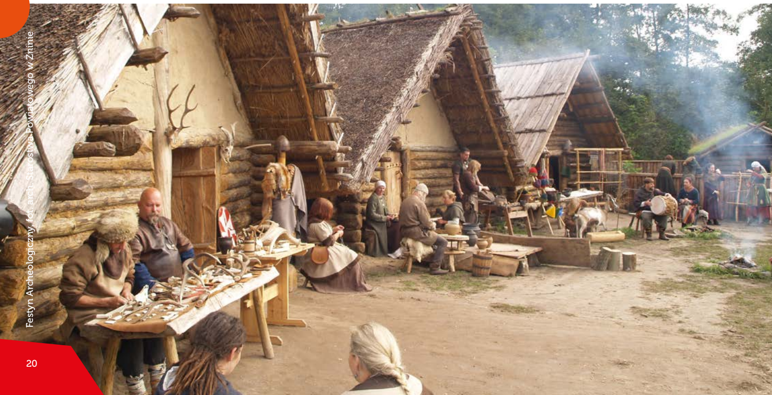
Festyn Archeologiczny