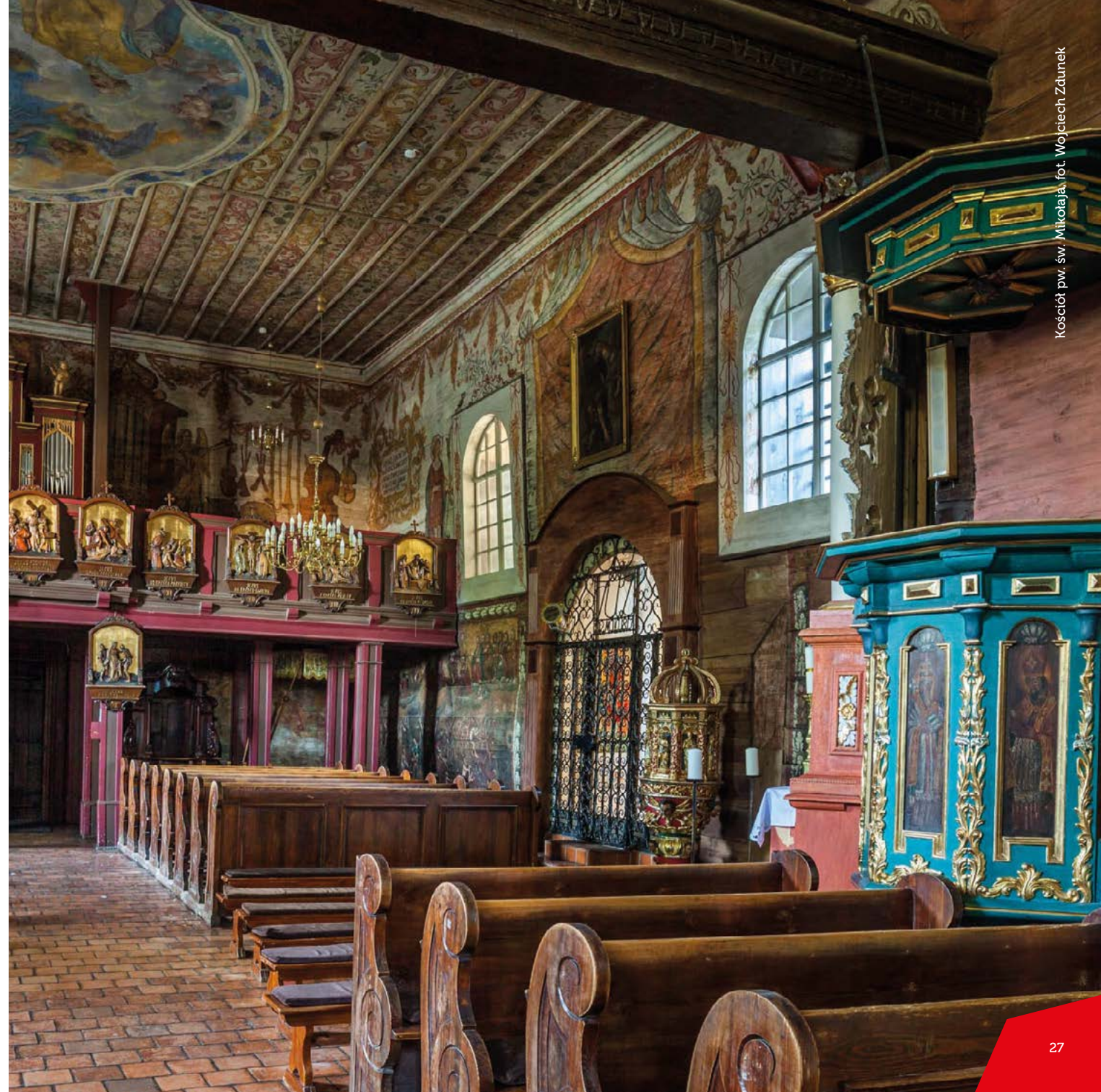
Kościół pw. św. Mikołaja