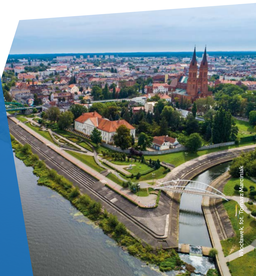
Włocławek, fot. Tomasz Marciniak

„Chodzenie z kozą” to praktykowany do dziś na Kujawach zwyczaj obchodzenia domów przez grupy barwnych przebiegaczy, przypadający na koniec karnawału (od tłustego czwartku do wtorku przed Popielcem). To kontynuacja dawnych ludowych obrzędów, mających na celu zapewnienie urodzaju. W 2020 r. wpisany został na Krajową Listę Niematerialnego Dziedzictwa Kulturowego.