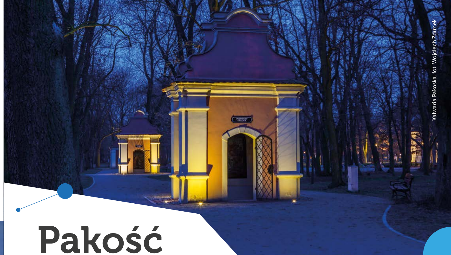
Kalwaria Pakoska