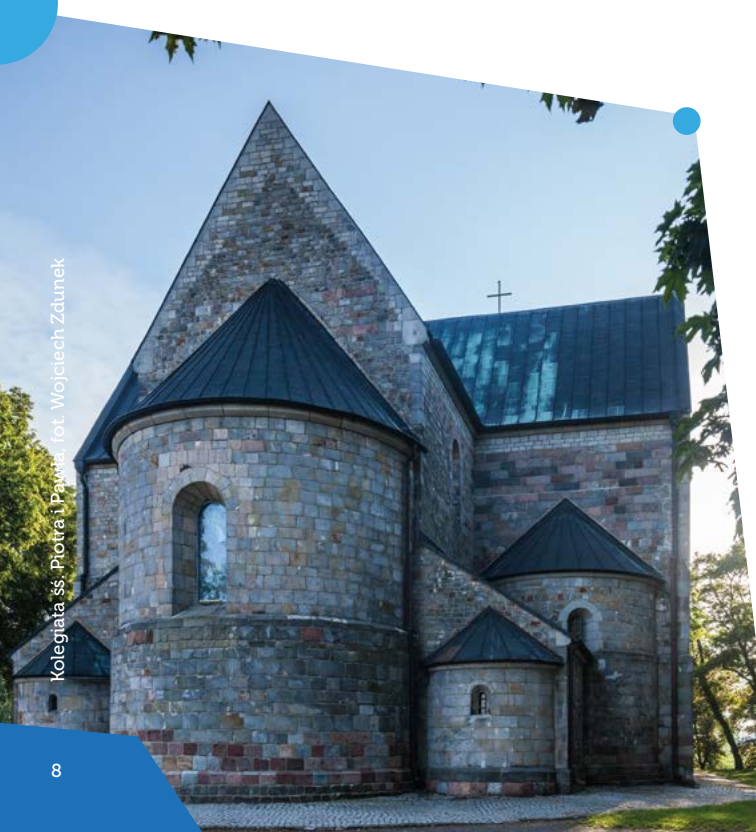
Kolegiata św. Piotra i Pawła