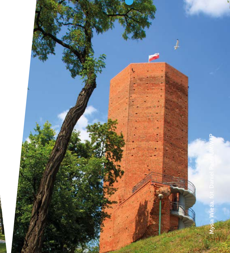
Mysią Wieża