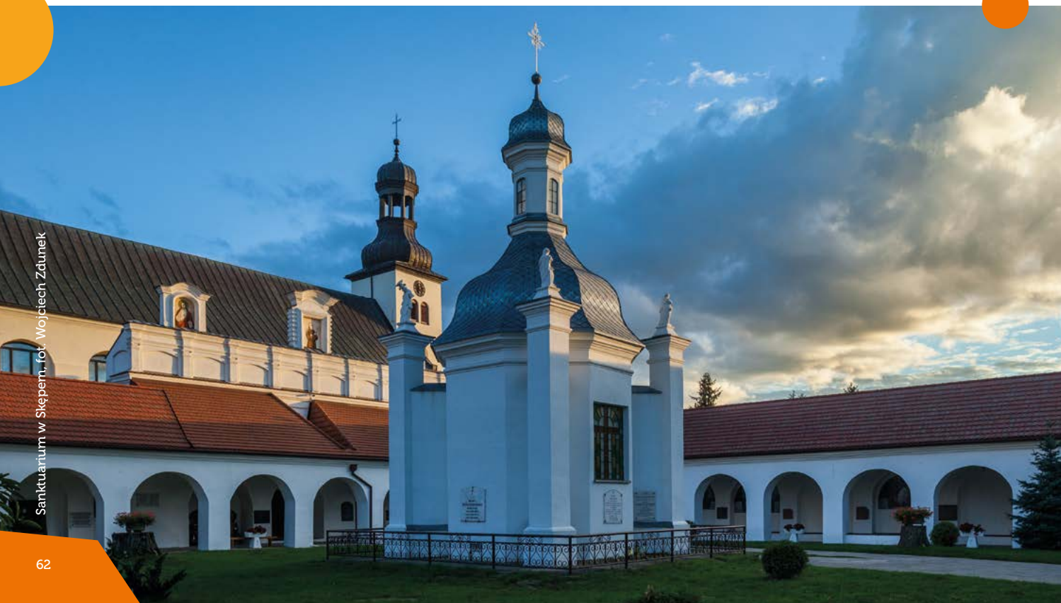
Sanktuarium w Skępem

Początki, mieszczącego się w murach klasztoru oo. Bernardynów, Sanktuarium Matki Bożej Skępskiej sięgają XV w. i związane są z pierwszymi objawieniami. Najcenniejszy skarb świątyni - cudowna figura Matki Bożej z 1496 r. zastynęła licznymi łaskami, rodząc kult, który trwa do dnia dzisiejszego.