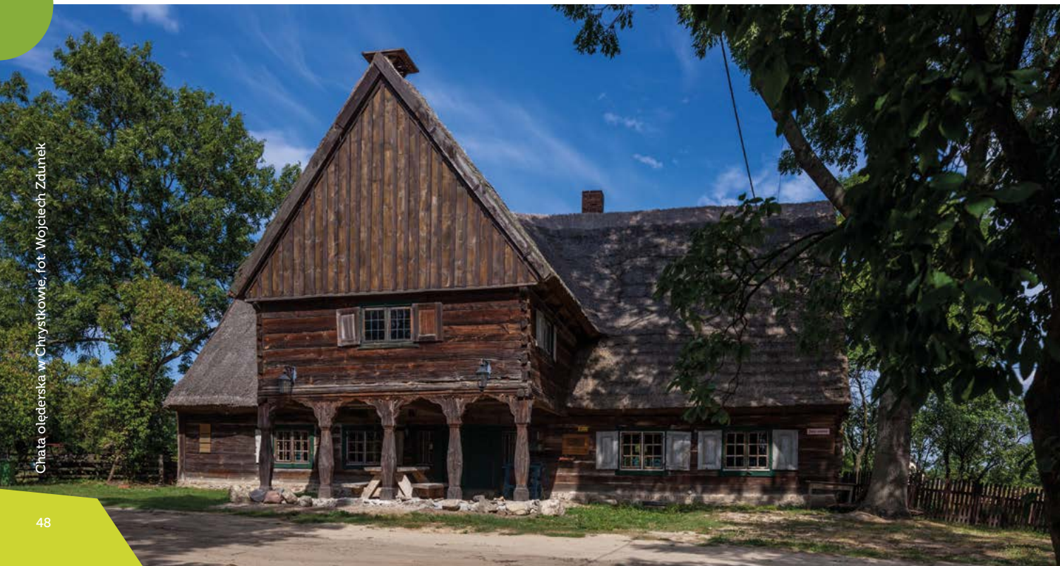
Chata olęderska w Chrystkowie

kowo to jeden z najcenniejszych i ostatnich obiektów olęderskich w Dolinie Dolnej Wisły. Stanowi przykład architektury doskonale przystosowanej do żywiołu powodzi. To drewniany, kryty strzechą trzcinową dom, z okazałym podcieniem, nad którym góruje użytkowe piętro, wykorzystywane dawniej jako spichlerz i pomieszczenie zastępcze podczas powodzi.