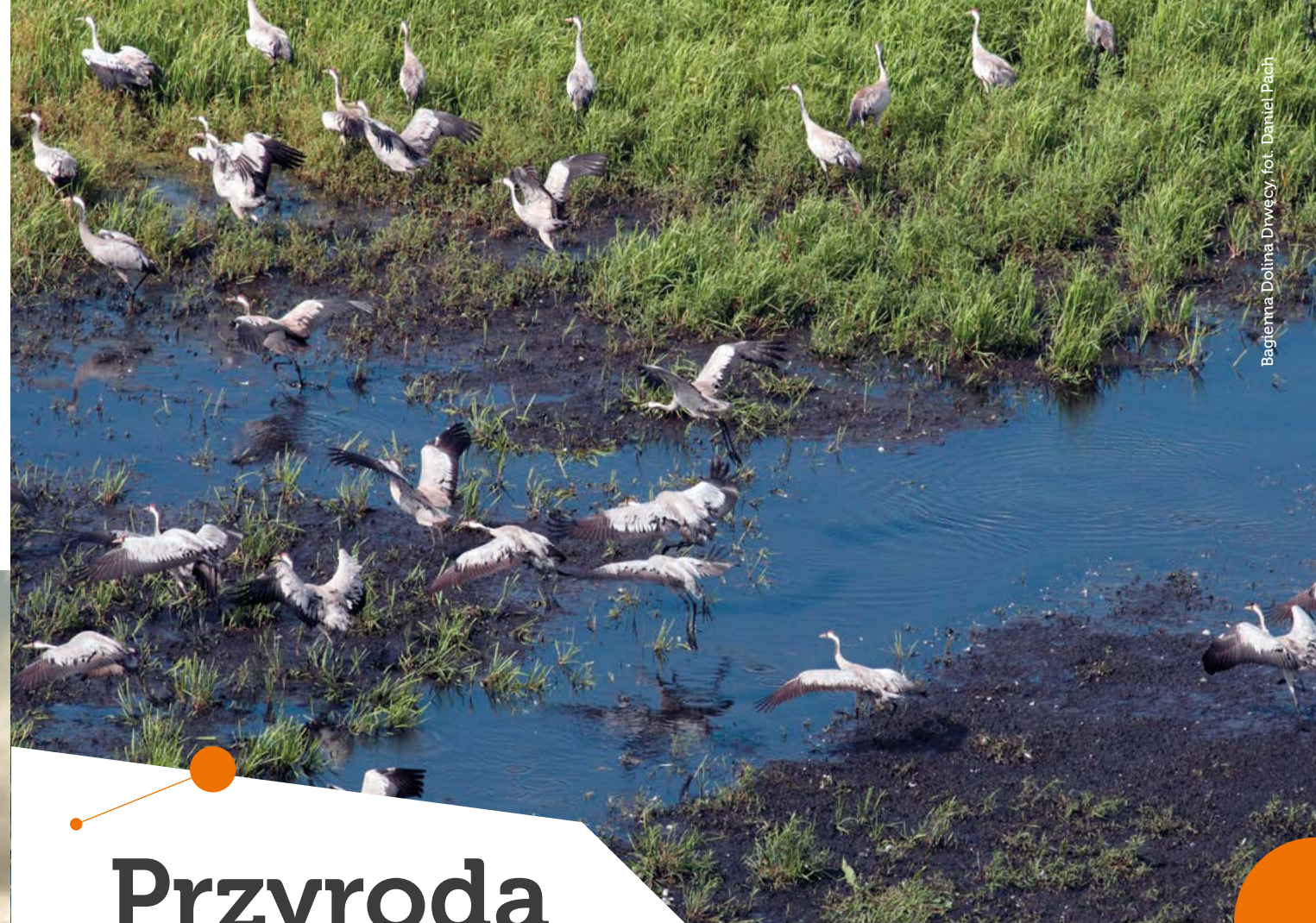
Bagienna Dolina Drwęcy