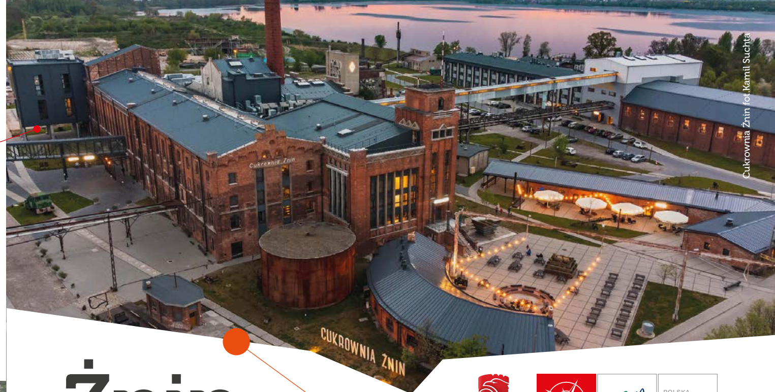
Cukrownia Żnin