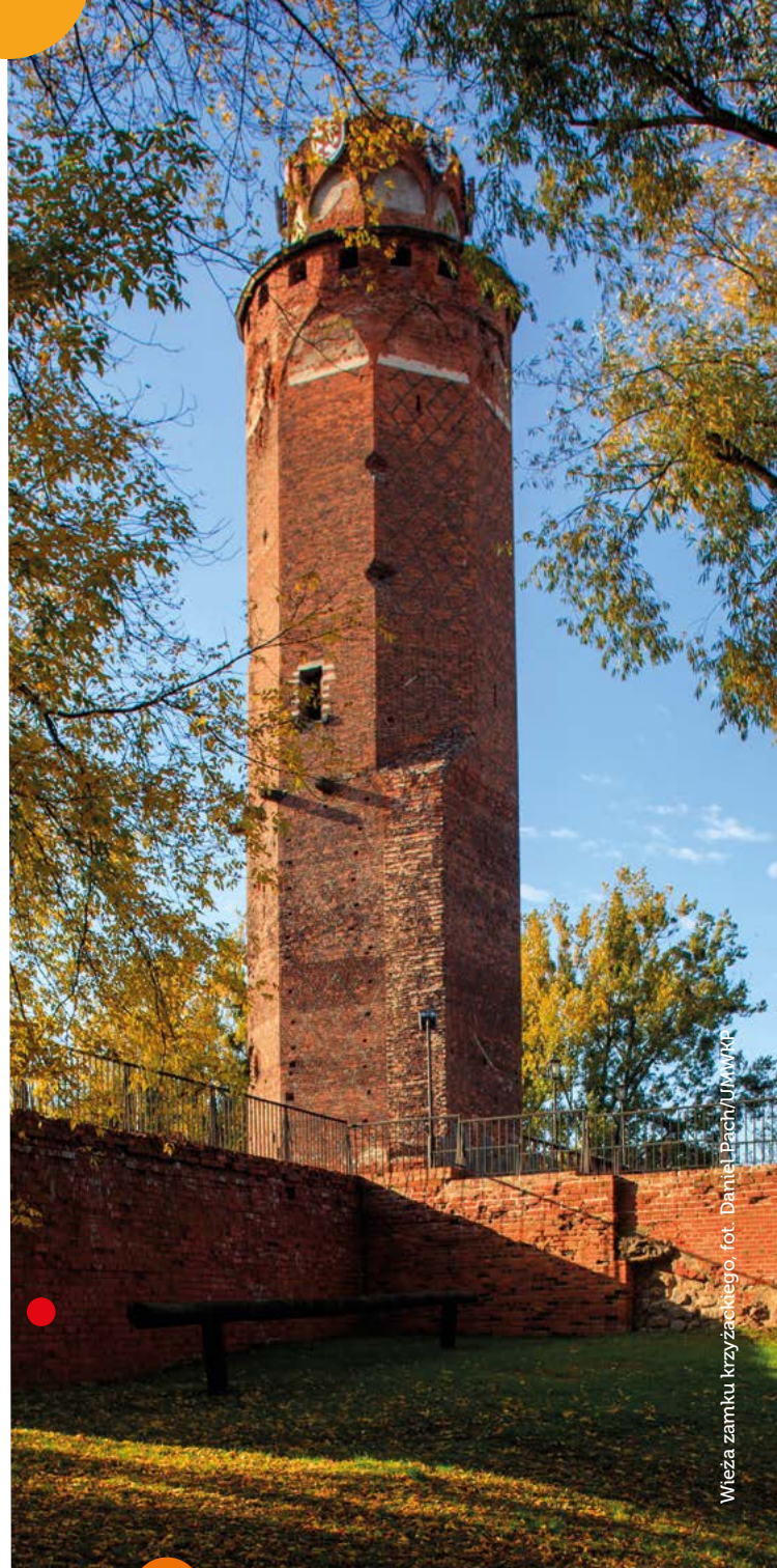
Wieża zamku krzyżackiego

Górująca nad miastem 54-metrowa wieża to pozostałość krzyżackiego zamku. Warto zejść do podziemi, by zwiedzić zamkowe piwnice pełne eksponatów przybliżających historię tego miejsca. Rozkwit miasta zawdzięcza Annie Wazównie, która w 1604 r. objęła starostwo brodnickie. Stworzyła silny ośrodek intelektualny, szczącą się tolerancją religijną. Interesująca się muzyką i literaturą królowna została mecenasem młodych artystów i ludzi o naukowych pasjach. Pasjonowała się botaniką i ziołolecznictwem, hodowała rośliny lecznicze i własnoręcznie sporządzała lekarstwa. Obowiązki starościny pełniła w dwóch ośrodkach – w 1611 r. objęła także starostwo golubskie. Anna Wazówna zmarła 6 lutego 1625 r. w Brodnicy. Z racji jej wyznania (w przeciwieństwie do brata, króla Zygmunta III Wazy, zagorzałego katolika, Anna była protestantką) nie wydano zgody na pochówek w rodzinnej krypcie Wazów w katedrze na Wawelu. Przez 11 lat ciało królowny czekało na pochówek na brodnickim zamku. W 1636 r. bratanek Anny Wazówny, król Władysław IV, sprawił jej pogrzeb godny królewskiego rodu. Miejscem jej wiecznego spoczynku został protestancki wówczas kościół Najświętszej Marii Panny w Toruniu.