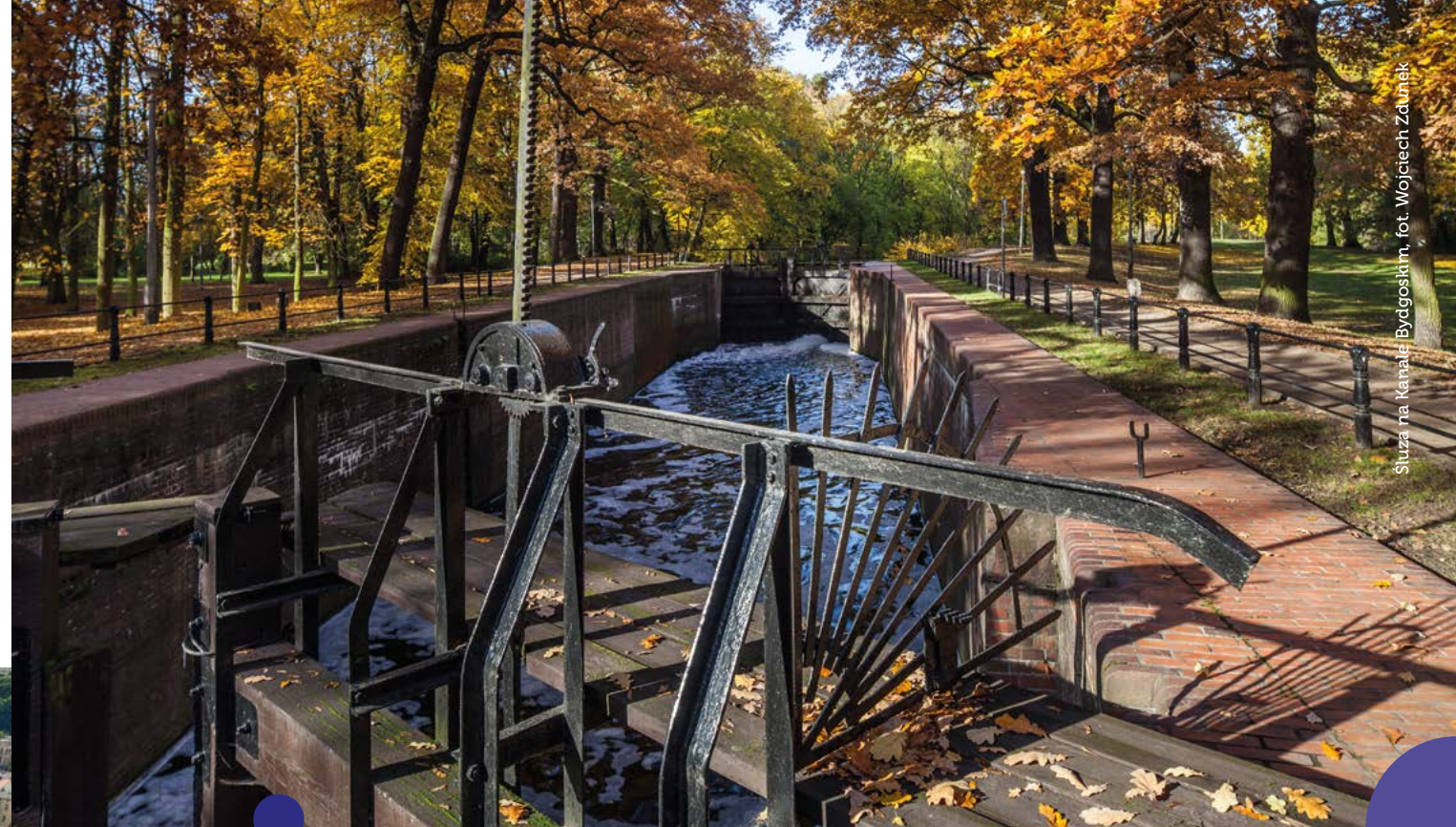
Służba na Kanale Bydgoskim

z perspektywy rzeki. Budzące dreszcz emocji słuzowanie, zgłębianie tajemnic Kanalu Bydgoskiego, dają szansę na zrozumienie nierozzerwalnego związku Bydgoszczy z wodą. Warto udać się na urokliwy spacer plantami nad Starym Kanalem i zajrzeć do Muzeum Kanalu Bydgoskiego, by pojąć, jak istotną rolę w rozwoju miasta odegrała historyczna inwestycja w ówczesną „wodną autostradę”. Muzeum Mydła i Historii Brudu (Certyfikat POT) nawiązuje do tradycji bydgoskich łaźni, wytwórni mydła i kosmetyków. W zabawny i niekonwencjonalny sposób odśladania domowe i publiczne arkana „higieny” – od starożytności po współczesność. To wyjątkowe