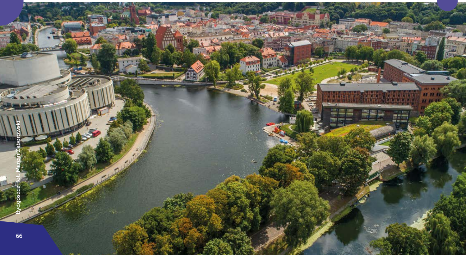
Bydgoszcz, fot. Marcin Zaborowski

areną Bydgoskiego Festiwalu Wodnego „Ster na Bydgoszcz”. Most im. Jerzego Sulimy Kamińskiego to idealne miejsce na pamiątkowe zdjęcie z Bydgoszczy. Roztacza się stąd ikoniczny śródmiejski widok: Brda ze swymi bulwarami, skupione przy nabrzeżach zabytki i balansująca na linii rzeźba „Przechodzącego przez rzekę”. Majestatyczne sylwetki trzech szachulcowych spichlerzy przypominają o istotnej roli, jaką przez stulecia odgrywał w życiu Bydgoszczy handel rzeczny, w tym pozyskiwanym z catych Kujaw zbożem. Cumująca przy nabrzeżu Brdy Barka Lemara opowiada o pracy i codziennym życiu szyprów, o dawnej żegludze i tętniącej życiem rzece. Uwiecznione na szyldach nazwy rynków podpowiadają, że niegdyś kwitły tu interesy. Podczas rejsu tramwajem wodnym można podziwiać urok miasta