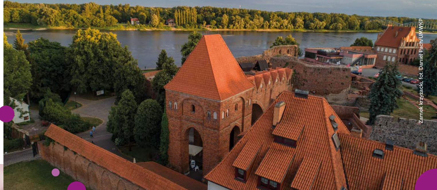
Zamek krzyżacki

wspólne wyprawy zaowocowały ogromnym zbiorem eksponatów, które dziś wypełniają wnętrza muzeum. Muzeum Sztuki Dalekiego Wschodu to z kolei miejsce dla miłośników świata orientu. Zobaczysz tu najcenniejsze zabytki z Chin, Syjamu, Tybetu, Japonii i Indii. Muzeum mieści się w Kamienicy pod Gwiazdą – jednej z najpiękniejszych kamienic w Toruniu. Nosi ona ślady różnych epok, od gotyckich murów, przez bogato zdobioną barokową fasadę, po wnętrza, których układ pochodzi jeszcze z okresu renesansu. W niezmierny wymiar przeniesie Cię Centrum Popularyzacji Kosmosu