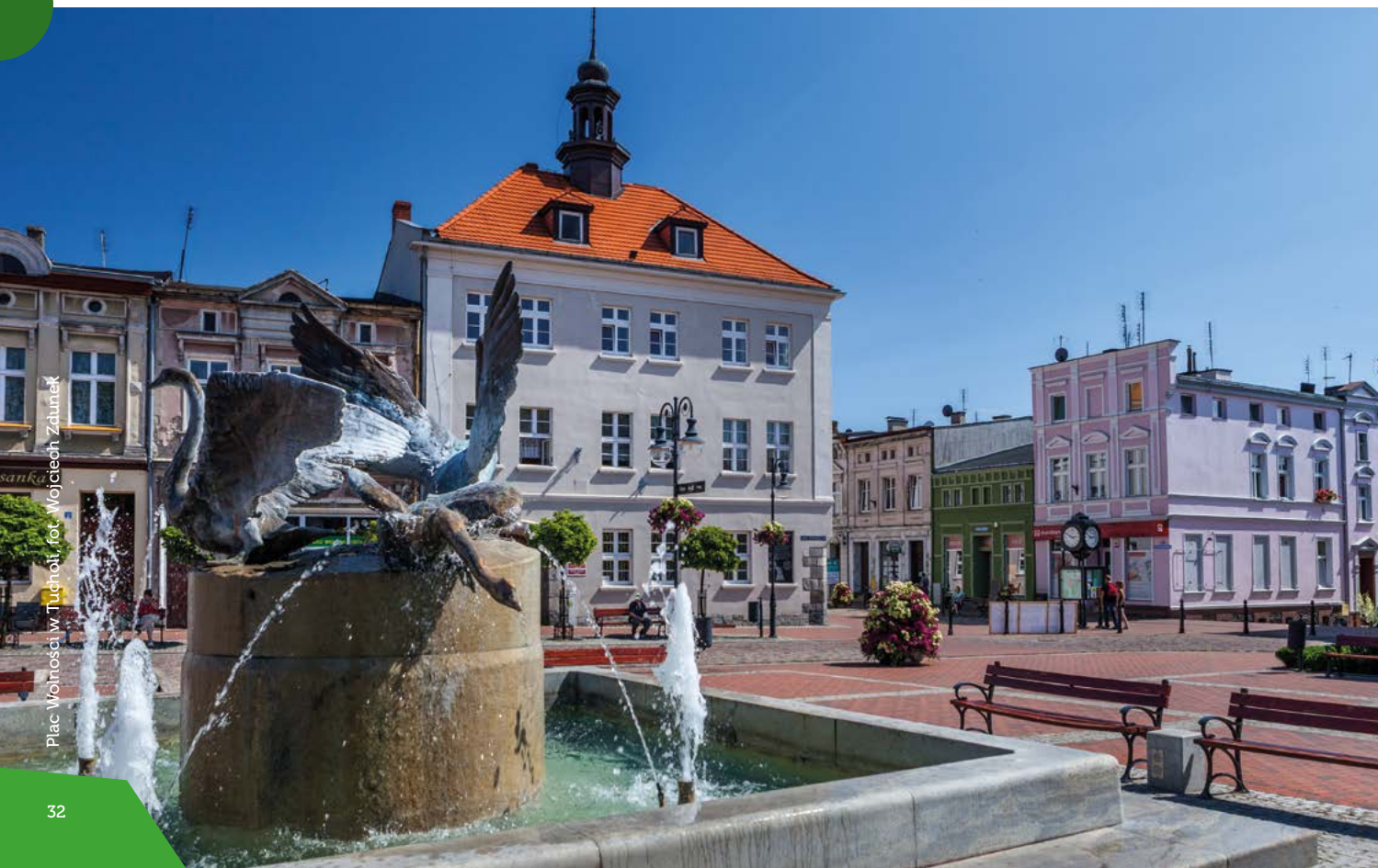
Płac Wolności w Tucholi

pomagały mieszkańcom w powszednich zajęciach. Poznasz bogatą faunę i florę Borów Tucholskich, a przyglądając się makiecie średniowiecznej Tucholi, odkryjesz historię jednego z najstarszych miast na Pomorzu.