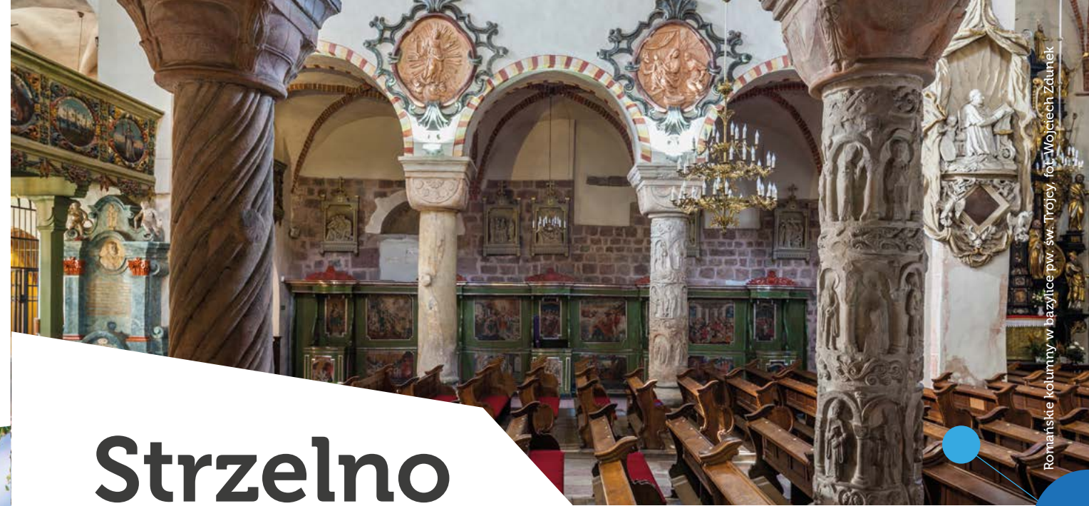
Romańskie kolumny w bazylice pw. św. Trójcy